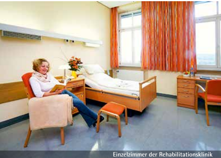
Einzelzimmer der Rehabilitationsklinik

In unserer Rehabilitationsklinik wohnen Sie überwiegend in Einzelzimmern. Für Patienten mit Angehörigen und Begleitpersonen stehen Zweibettzimmer zur Verfügung.