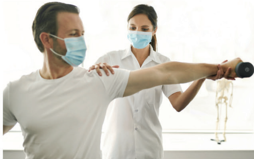
Bewegung für ein Weg zurück ins Leben

In der Rangauklinik werden deshalb verschiedene Reha-Bausteine wie zum Beispiel die tägliche Atemtherapie bewusst als Gruppen-