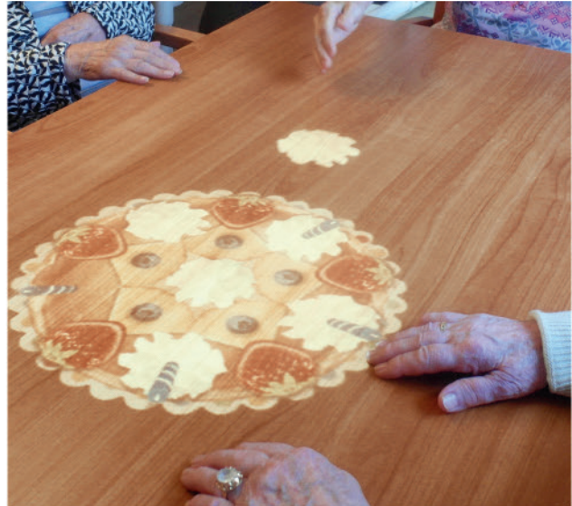
Jeder hat ein Recht auf Spielen