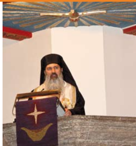
Rumänische Nonnen im Eröffnungsgottesdienst. Die Nonnen lernten die soziale Arbeit in verschiedenen Einrichtungen der Diakonie Neuendettelsau kennen.

nächsten Wochen die Arbeit der Diakonie Neuendettelsau bei Hospitälern in den Einrichtungen der Behinderten- und Altenhilfe kennen lernen wollte. Oberkirchenrat Detlef Bierbaum lobte das neue Zentrum in Neuendettelsau als einen „Ort, an dem Wort und Tat zusammen kommen.“ Damit werde Spiritualität ganzheitlich.