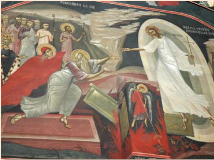
Darstellung der Auferstehung in der Rumänischen Orthodoxen Kathedrale in Nürnberg

Jesus Christus spricht: Ich bin die Auferstehung und das Leben. Wer an mich glaubt, der wird leben, auch wenn er stirbt. Johannes 11,25