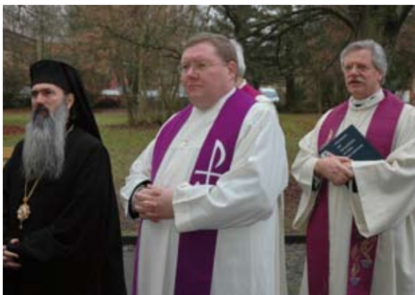
Auszug nach der orthodoxen Vesper aus St. Laurentius.