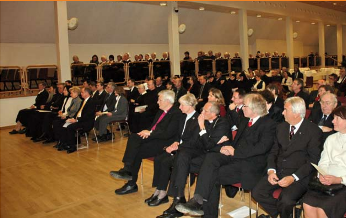
Zahlreiche Gäste aus Kirche, Staat und Wirtschaft konnten zur Eröffnung des Ökumenischen Geistlichen Zentrums im Luthersaal begrüßt werden.

Gaben in Europa mit anderen Bürgern teilen.