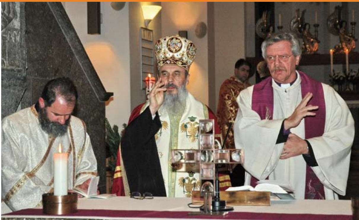
Abschlusseggen der ökumenischen Vesper