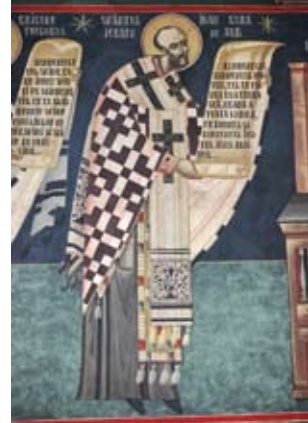
Auch in der Kirche der Metropole in Nürnberg findet man den Heiligen Chrysostomos.

Alexandria und den erwähnten Basilius und Gregor).