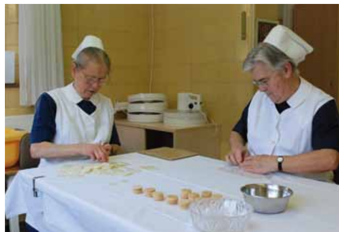
Zwei Feierabendschwestern in der Hostienbäckerei.

Alle Angebote im Haus verstehen sich als Angebot und nicht als ein Muss. Jede Diakonisse bringt ihre Begabungen in die Hausgemeinschaft ein. Dabei werden sie von der Hausleitung unterstützt und gefördert. Trotz aller Individualität verstehen sich die Diakonissen als Gemeinschaft. Eine Diakonisse hat es einmal so beschrieben: „Was uns als Schwestern am meisten verbindet, ist der Auftrag, den wir von Gott bekommen haben und auch immer noch be-