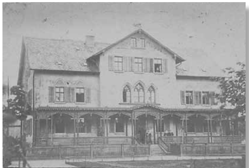
Im Jahre 1877 wurde das erste Feierabendhaus errichtet.

Für Diakonissen bedeutet der Begriff „Feierabend“ ihren Lebensabend, den sie im Feierabendhaus verbringen. Das Leben in den Neuendettelsauer Feierabendhäusern, dem Karoline-Rheineck-Haus, dem Amalie-Rehm-Haus, dem Hans-Lauerer-Haus und dem Selma-Haffner-Heim, ist vielfältig und lebendig, von einem gemeinsamen und individuellen Tageslauf geprägt. Einen wichtigen Punkt im Leben der Schwestern des Feierabendhauses stellen die Tages-