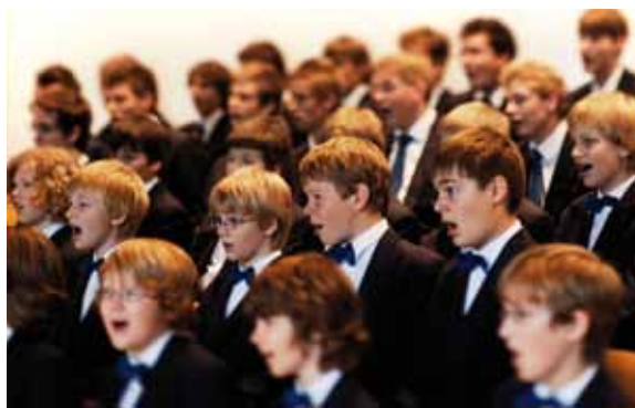
Der Windsbacher Knabenchor bietet jungen Menschen die Möglichkeit, in einem international renommierten Chor mitzuwirken.

entfalten soll“, betont Beringer. Was natürlich nicht ausschließt, dass auch bei großen nationalen und internationalen Festen der Chor auftritt und durch seine künstlerische und geistliche Ausdruckskraft zum Botschafter des Friedens wird.