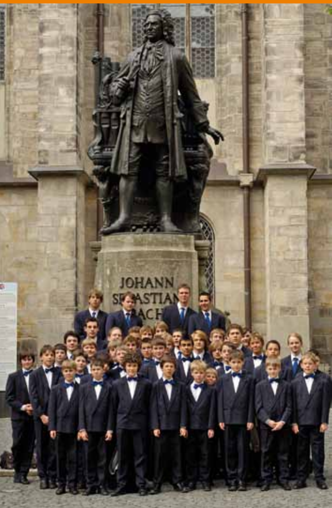
Werke von Johann Sebastian Bach gehören zum Standardrepertoire des Windsbacher Knabenchores.

Der Windsbacher Knabenchor zählt heute zu den führenden Ensembles seiner Art. Die geistliche Musik bildet den Mittelpunkt