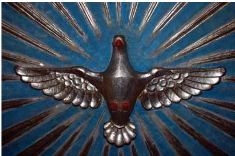
Die Taube ist das Symbol des Heiligen Geistes. Motive aus der Neuendettelsauer St. Laurentiuskirche.