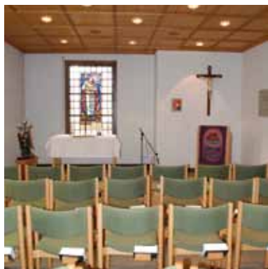
Der Betsaal des Karoline-Rheineck-Hauses.

Nach der Andacht oder dem Gottesdienst geht es um die praktischen Dinge, das Alltägliche. Arztbesuche werden gemacht, Besorgungen erledigt oder auch Aufgaben im Haus übernommen. Die Autofahrerinnen begleiten Mitschwestern zum Beispiel bei Arztbesuchen, andere kümmern sich um die Gartengestaltung, jede nach individuellen Fähigkeiten und Neigungen. Die Schwe-