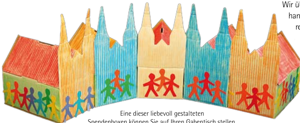
Eine dieser liebevoll gestalteten Spendenboxen können Sie auf Ihren Gabentisch stellen.

Wir übersenden Ihnen gerne ein handgefertigtes Unikat unserer Spendenbox in Form der Laurentiuskirche.