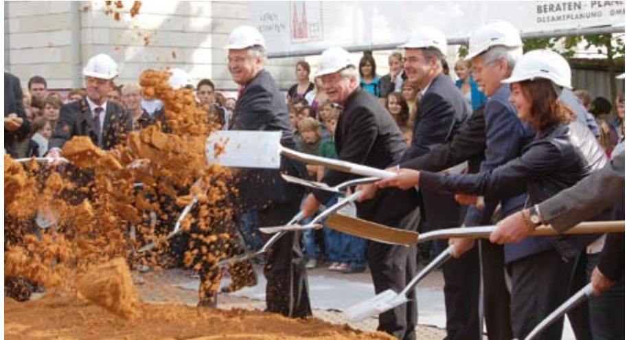
Innenminister Joachim Herrmann (2.v.l.) und weitere Ehrengäste machten den ersten Spatenstich.

„Lernen und Leben auf dem Löhe Campus, das ist unser Leitbild und dazu