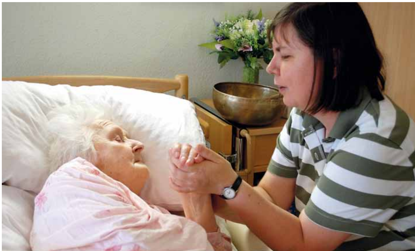
Die Betreuung von pflegebedürftigen Menschen stürzt die pflegenden Angehörigen oft in eine schwierige Situation.

wie lange eine Pflegesituation andauert – es können drei Wochen sein oder auch bis zu 20 Jahre. Vielen Angehörigen ist nicht klar, welche sozialrechtlichen Ansprüche sie haben und welche Hilfsmöglichkeiten angeboten werden. „Das ganze Leben dreht sich um die Pflegesituation“, erklärt die Beraterin. Schließlich kann es zu einem Burnout-Syndrom wie im Berufsleben kommen. Wenn die Pflegenden schließlich Rat und Hilfe suchen, ist es oft schon zu spät. Die Angehörigen plagen Schuldgefühle, trotz ihres immensen Einsatzes noch immer zu wenig für die kranken Familienmitglieder zu tun. Manch einer geht an seine Grenzen und darüber hinaus – aus Liebe und aus Angst vor der drohenden Einsamkeit. Nach dem Tod des gepflegten Angehörigen kann der totale Zusammenbruch folgen.