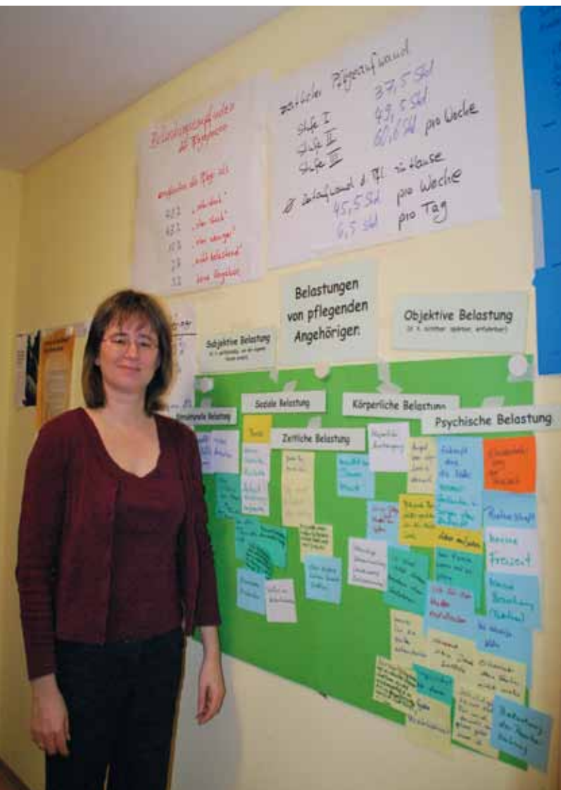
In der Ansbacher Beratungsstelle der Diakonie Neuendettelsau für pflegende Angehörige wurden die vielfältigen Belastungen pflegender Angehöriger auf einer Schautafel zusammengetragen.

Manche Betroffene geben ihren Job auf, um ein Familienmitglied zu pflegen, was zu finanziellen Einbußen führt, nicht zuletzt in der Rentenversicherung. Schließlich ist es völlig offen,