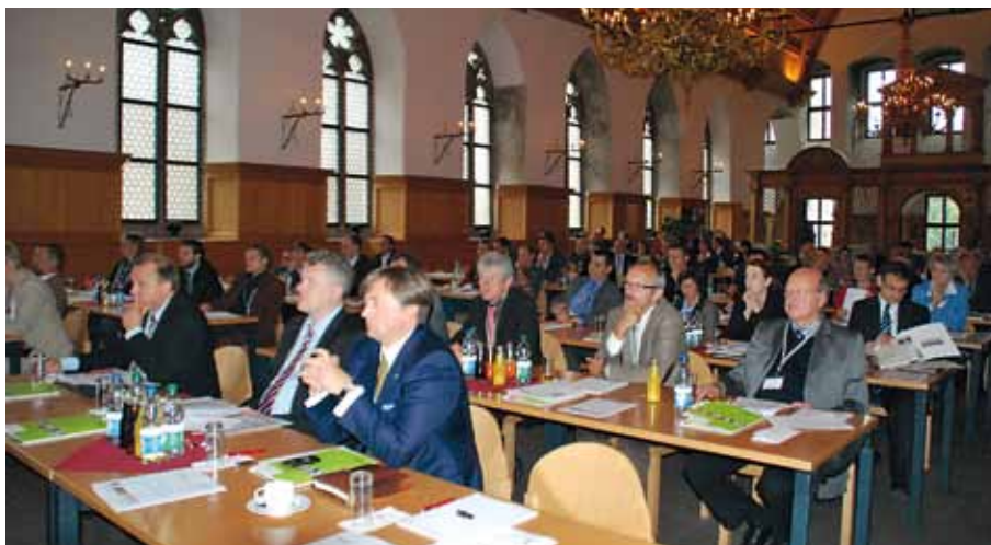
Gut besucht war der Kongress „Lebensraum – Lebenstraum“ im Historischen Rathaussaal.

Kongress „Lebensraum – Lebenstraum“ im Historischen Rathaussaal in Nürnberg