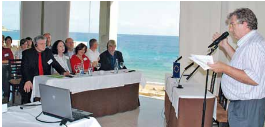
Den Teilnehmern der SoCareNet-Tagung wurde auch der neue Pflegedienst DiaCare der Diakonie Neuendettelsau im spanischen Calpe vorgestellt.

Mehr Informationen unter www.socarenet.org